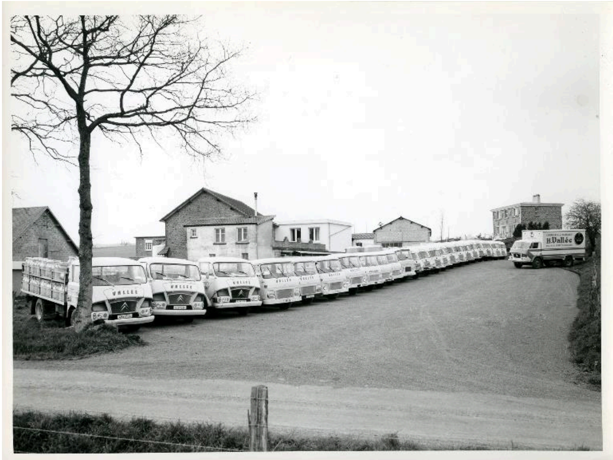
Parc automobile de la fromagerie, servant à la collecte de lait pour les sites de Berjou, Clécy et Saint-Georges-des-Groseilliers.- Photographie ancienne, fotogr. studio Desaunay, Condé-sur-Noireau, années 1970. (Collection particulière Jean Vallée).