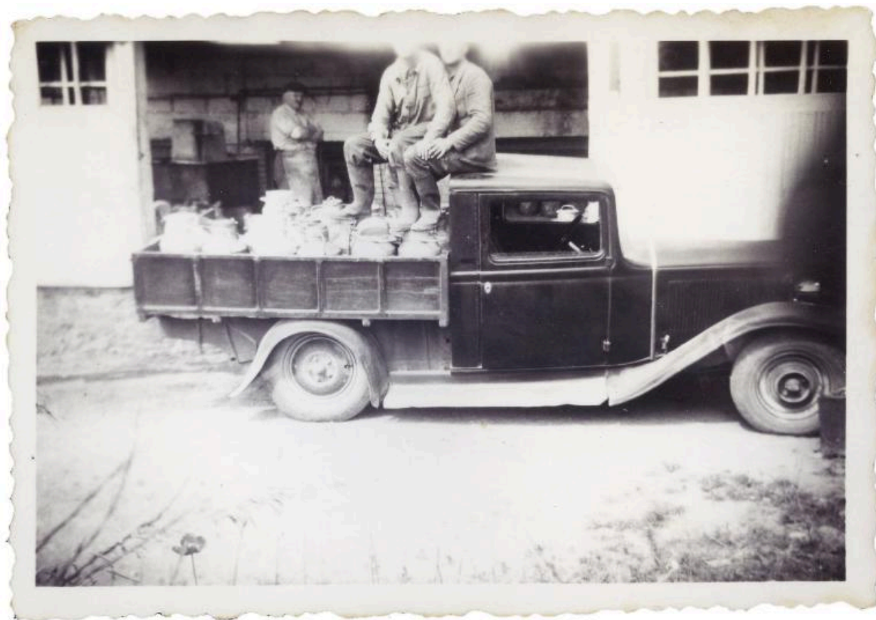
Camionnette chargée de bidons de lait avec ouvriers.- Photographie ancienne, s.d. (Collection particulière Jean Vallée).