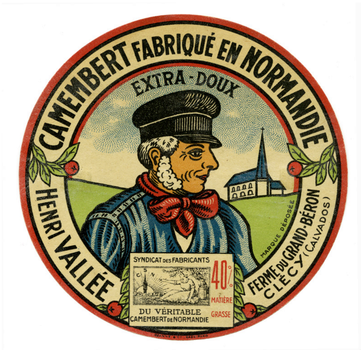
Etiquette de fromage "Camembert fabriqué en Normandie, Henri Vallée, Ferme du Grand-Béron, Clécy (Calvados), Extra-Doux, marque déposée, étiquette du Syndicat des fabricants du véritable camembert de Normandie, 40% matière grasse".- Etiquette de fromage, Ozanne & Cie, Caen-Paris. (Musée de Normandie, Caen).