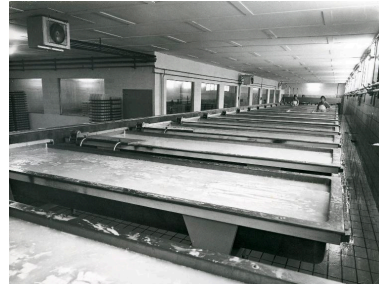
Cuves.- Photographie ancienne, vers 1970. IVR25_20141400262NUC2AB