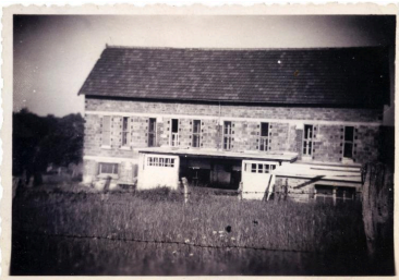
Bâtiment de la deuxième fromagerie, avec hâloirs.- Photographie ancienne, s.d. IVR25_20141400258NUC2AB