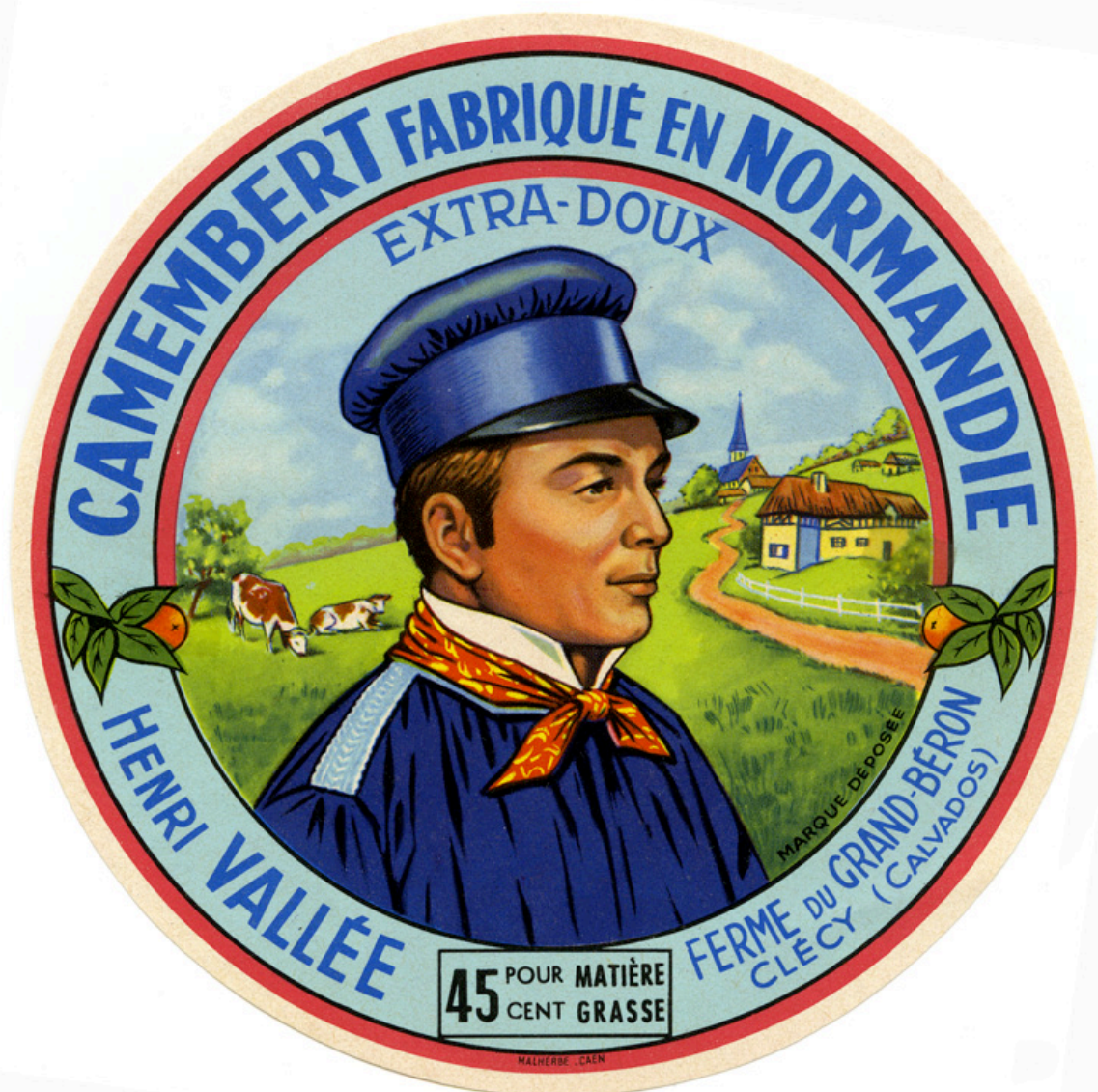
Etiquette de fromage "Camembert fabriqué en Normandie, Henri Vallée, Ferme du Grand-Béron, Clécy (Calvados), Extra-Doux, marque déposée, 45 pour cent matière grasse".- Etiquette de fromage, Imp. Malherbe, Caen. (Musée de Normandie, Caen).