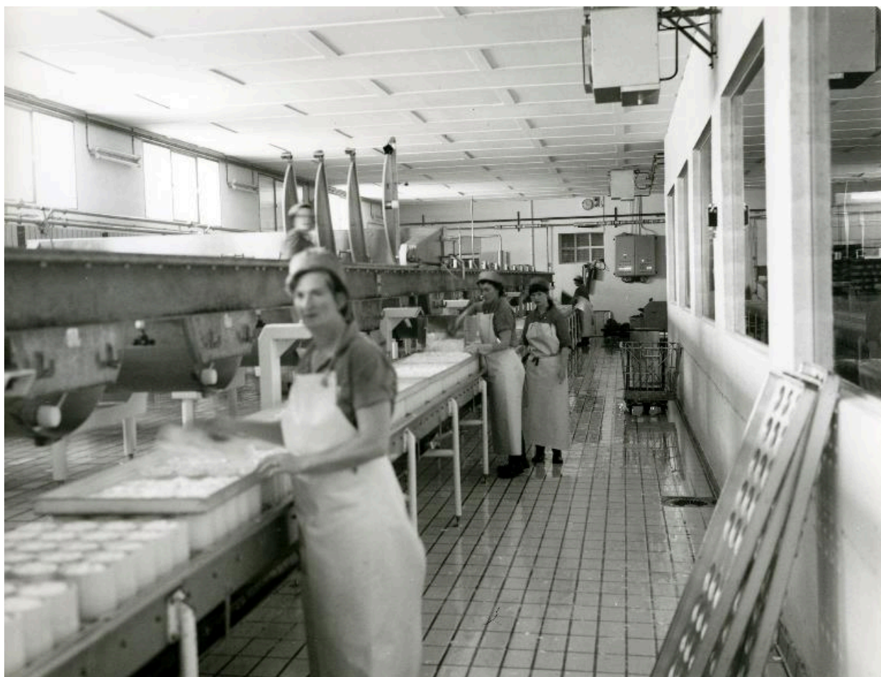
Chaîne de moulage.- Photographie ancienne, 1973. (Collection particulière Jean Vallée).