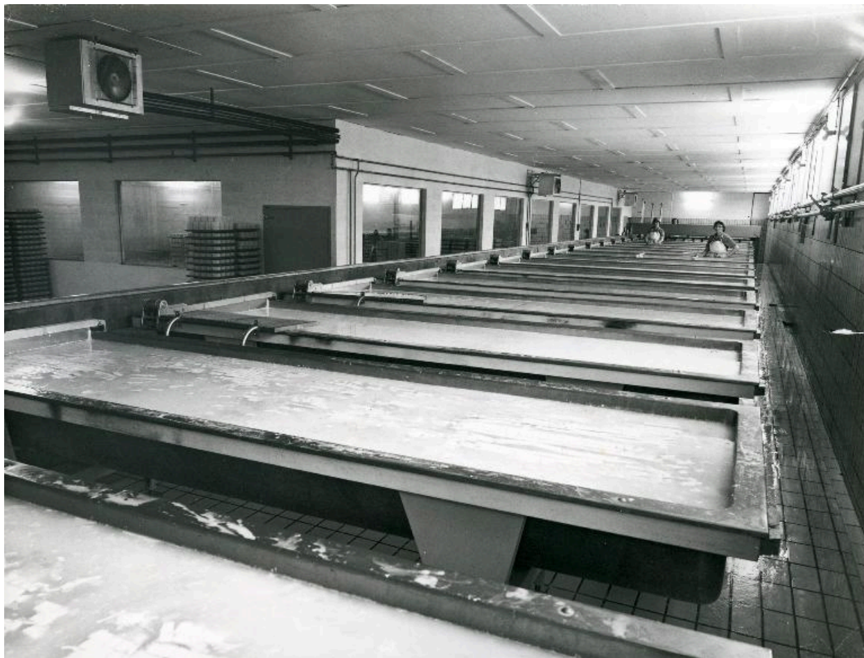
Cuves.- Photographie ancienne, vers 1970.