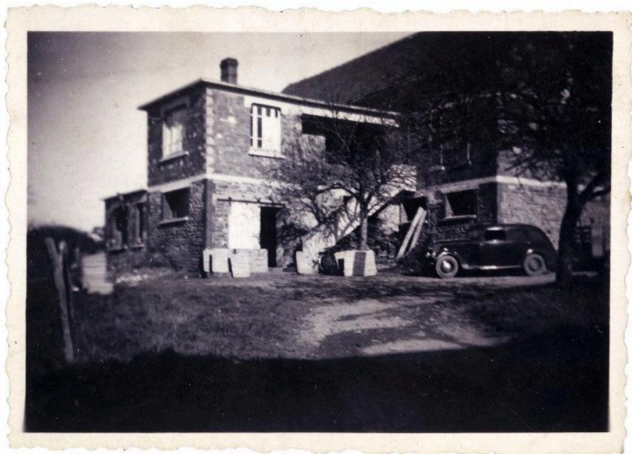
Bâtiment de la deuxième fromagerie.- Photographie ancienne, s.d. (Collection particulière Jean Vallée).