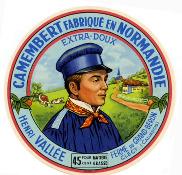
Étiquette de fromage "Camembert fabriqué en Normandie, Henri Vallée, Ferme du Grand-Béron, Clécy (Calvados), Extra-Doux, marque déposée, 45 pour cent matière grasse".- Étiquette de