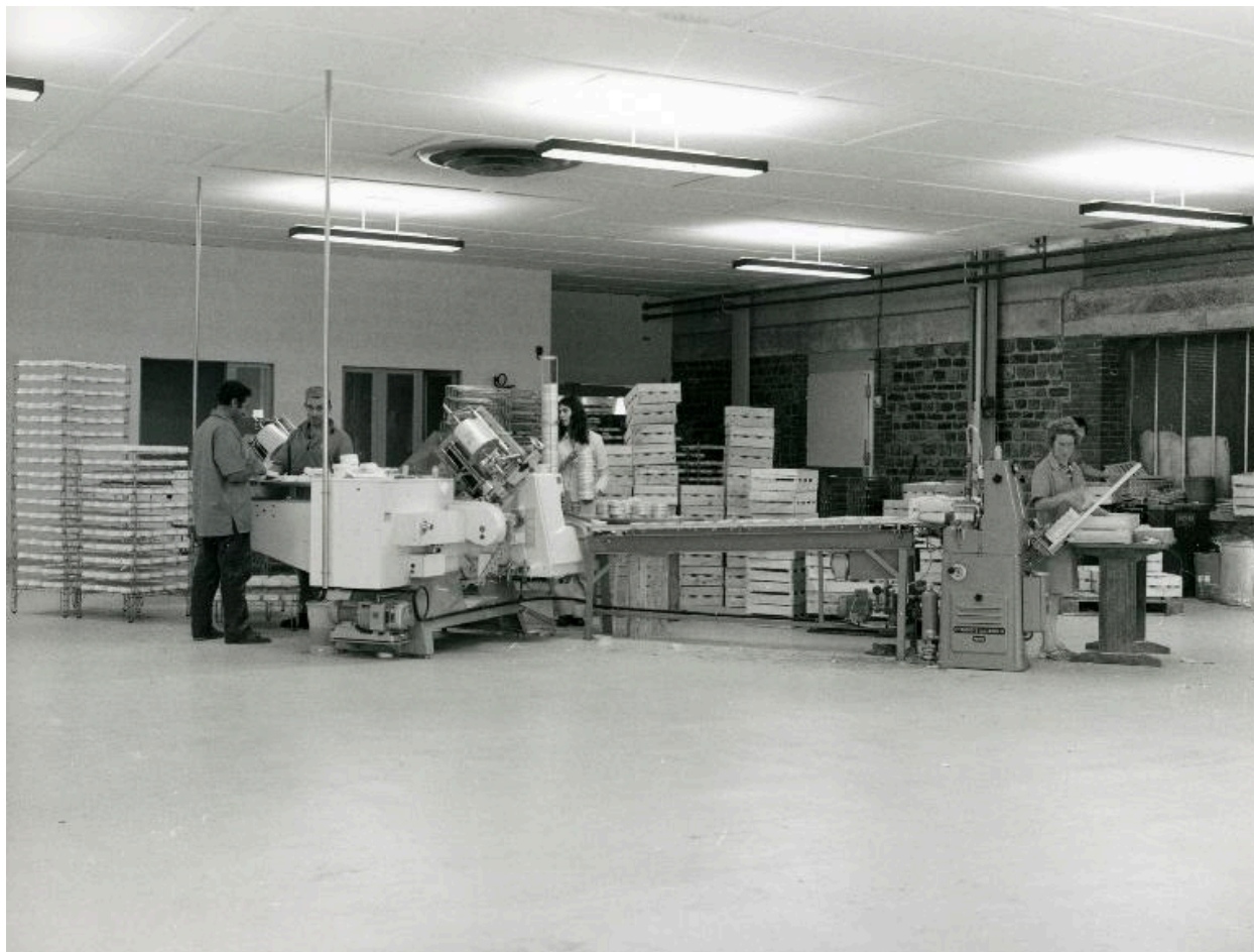
Atelier de conditionnement.- Photographie ancienne, 1970.