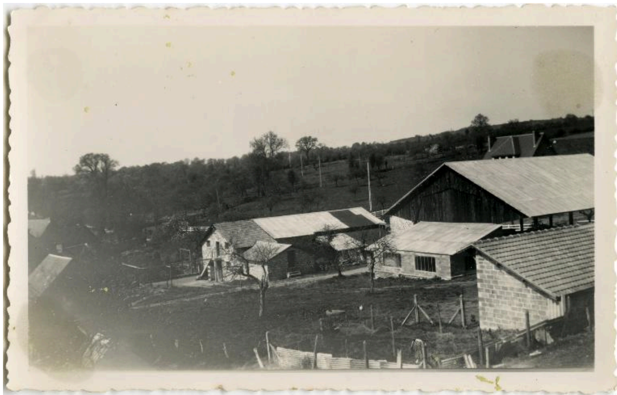
Fromagerie du Grand Béron.- Photographie ancienne, 1953.